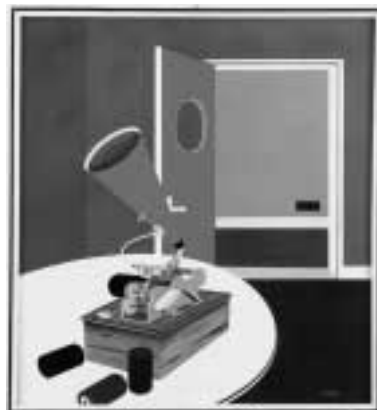
Alcune foto tratte dal catalogo "Guido Natale Frabboni" in vendita nella sede del Museo