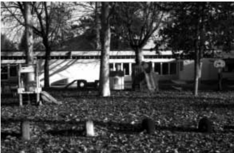
Un'immagine della Scuola Materna di via Tolomelli

Lo spazio del gioco simbolico consente il gioco del "far finta di..." di sperimentare il gioco dei ruoli (per esempio fare alla mamma, al dottore, al fornaio..) o di impersonare eroi, fate, maghi e tutto il "fantastico" che i bambini sanno inventare a partire dalle proprie esperienze ed emozioni. Perfino lo spazio del bagno vuole riconoscere uno spazio preciso a ciascun bambino, anche qui con un riconoscimento dell'identità ed un input all'autonomia personale anche nella cura della propria persona secondo modi e tempi individuali. Per quanto riguarda i "numeri" della nuova materna, complessivamente le sei sezioni ospiteranno ciascuna ventisei bambini, con una distribuzione studiata in modo abbastanza flessibile. Infatti le sezioni A e B saranno eterogenee, ossia saranno composte di bambini di tutte le età (tre, quattro e cinque anni) tutti insieme, mentre le sezioni C, D ed E saranno omogenee, ossia nella C quelli di tre anni, nella D quelli di quattro e nella E quelli di cinque.