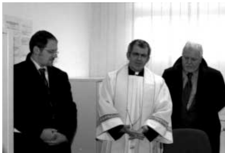
L'inaugurazione di sabato 6 dicembre

Negli ultimi anni era stata accolta nella RSA, dove il 5 dicembre del 2002 aveva compiuto i 105 anni.