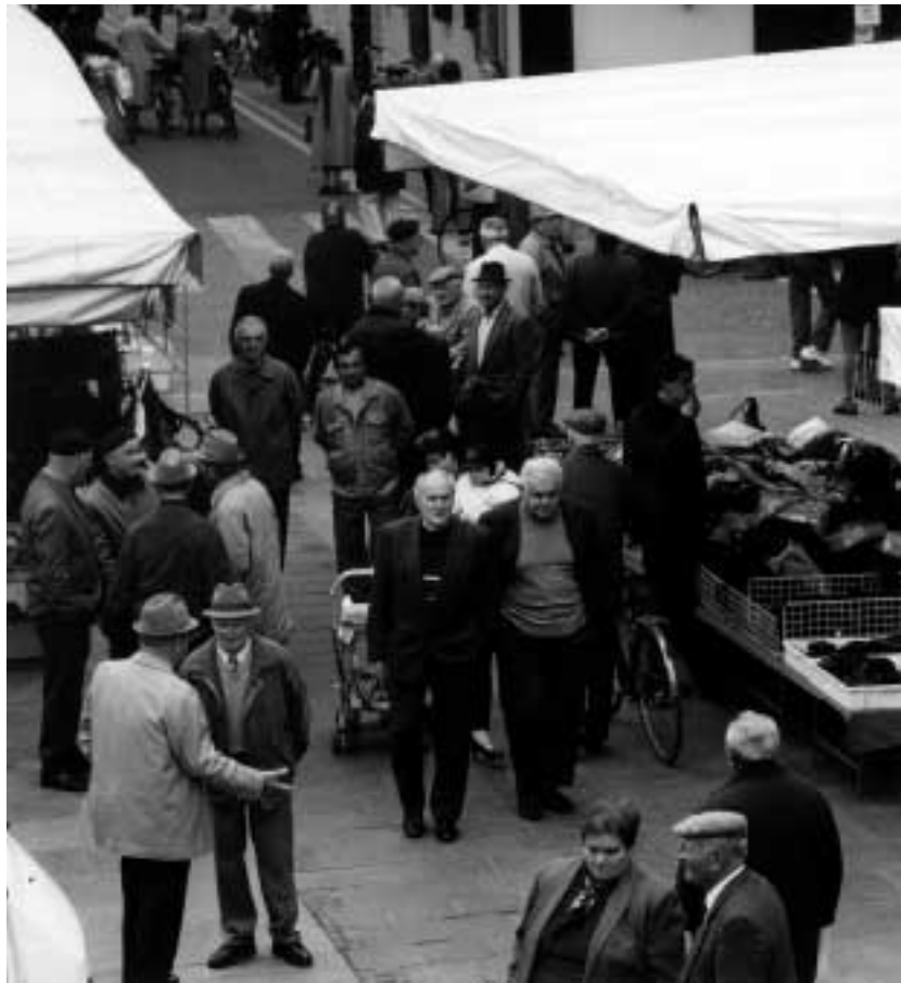
Un terzo dei cittadini va in piazza tutti i giorni per incontrarsi e stare assieme.

E' il caso del problema più citato, quello del traffico e viabilità, che ottiene la palma negativa, ma con un modesto 7,4%. Segue la convivenza con immigrati stranieri, problema che peraltro appare del tutto "sotto controllo": oltre i due terzi (68%) degli interpellati considera buone o sufficienti le politiche della giunta sul tema dell'immigrazione, una percentuale media migliore di quella nazionale. E guardiamo invece i "primati": scuola, servizi per l'infanzia e politiche ambientali sono al top della classifica, con l'86,5% degli interpellati che li promuove. Ben i tre quarti dei cittadini, poi, promuove a pieni voti anche il funzionamento degli uffici pubblici. Le aree in cui il punteggio supera il 50 per cento di promozioni sono poi: trasporto pubblico, sicurezza, attività sportive, cultura, anziani, sanità, manutenzione strade, traffico e commercio. Solo le politiche giovanili non riscuotono entusiasmo, e quelle per la casa, ma va detto che anche la quota di cittadini che ammettevano di non conoscere il proble-