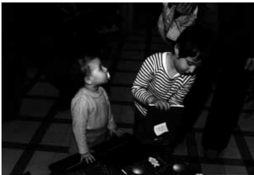
I servizi per l'infanzia sono un punto di eccellenza riconosciuto dai cittadini.

ne siano più che discrete: si vive a lungo - ben l'11,7% ha un'età superiore ai 75 anni e il 35,2% della popolazione è pensionata - quando si è nell'età giusta si lavora - nelle maggioranze delle famiglie di due persone entrambi i componenti lavorano - si vive in casa di proprietà (87,2%), solo lo 0,7% si ritiene in condizione economica disagiata e il 12,8% con qualche problema a tirare fine mese. La percezione che la situazione economica sia peggiorata nell'ultimo anno coinvolge tuttavia anche oltre un terzo dei sanpierini. Dal punto di vista invece dei rapporti sociali, l'impressione è che si viva in una sorta di oasi di buone relazioni: solo il 10% degli interpellati afferma di non farsi coinvolgere dai rapporti di vicinato, e l'8% si lamenta di conflitti, autentici o occasionali. Per il resto, pare che ci si frequenti molto. In particolare, oltre ad incontrarsi in casa o in pizzeria, resta forte il richiamo della "Piazza". Si va in centro non per motivi di lavoro o studio - il 36% tutti i giorni - ci si incontra in piazza (56,9%) o al bar. Oltre la metà degli intervistati ritiene di avere molti amici. Questa qualità della vita va di pari passo alla qualità dell'amministrazione, che riceve come voto