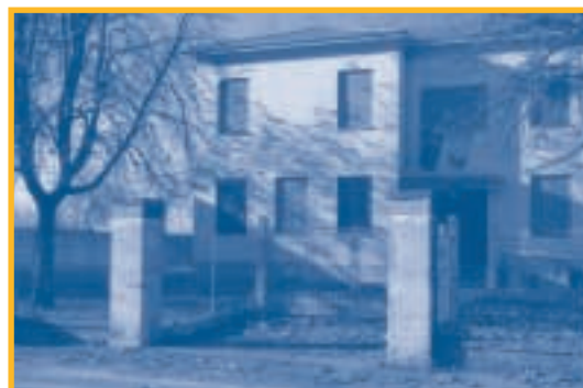
La vecchia scuola di Poggetto

Un progetto innovativo, un' autentica scuola “rurale”, fiera di esserlo e laboratorio per un'idea di edilizia scolastica non standardizzata, ma pensata a misura delle comunità. Poggetto non è una metropoli, è una frazione di un comune della pianura e ha le caratteristiche tipiche di una località di campagna: spazi aperti, verde, campi coltivati e fabbricati che si richiamano alle attività agricole. La scelta, compiuta dall'amministrazione comunale nel luglio scorso, dopo che l'edificio che ospitava la scuola aveva dato segni di cedimento strutturale, è stato di mantenere comunque l'attività scolastica nella frazione, trasferendo temporaneamente i bambini e i docenti in altre strutture di San Pietro. A quel punto, l'alternativa era tra la sistemazione del vecchio edificio e la costruzione di un altro,