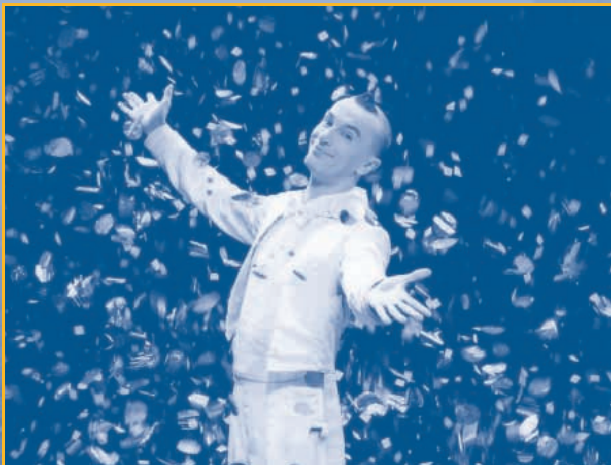
Arturo Brachetti in uno spettacolo di Tracce 2004