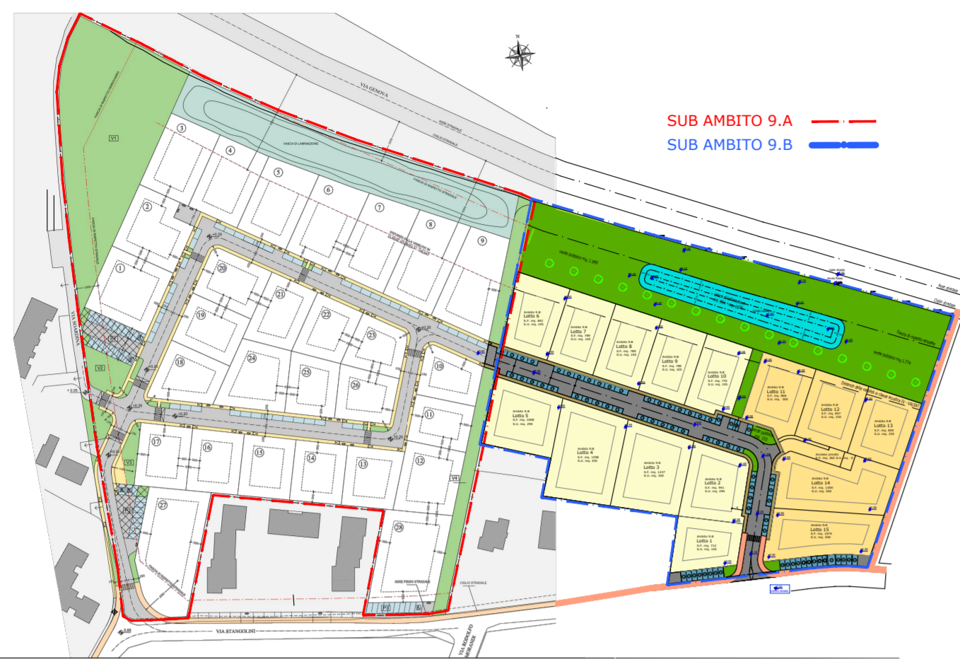
planimetria generale Sub Ambiti 9.A e 9.B - scala 1:2500