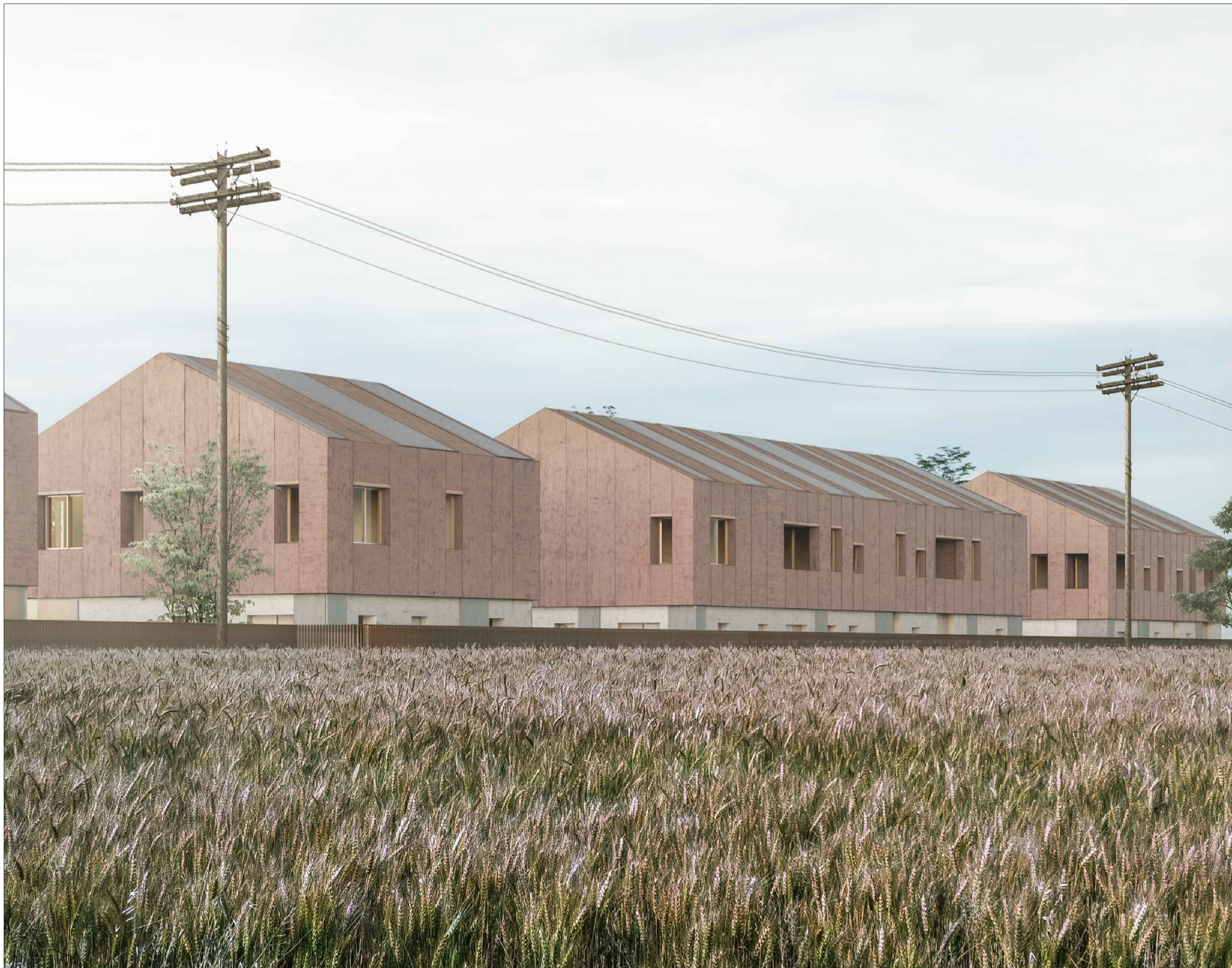
VISTA ESTERNA ALTEZZA UOMO - EDIFICATO