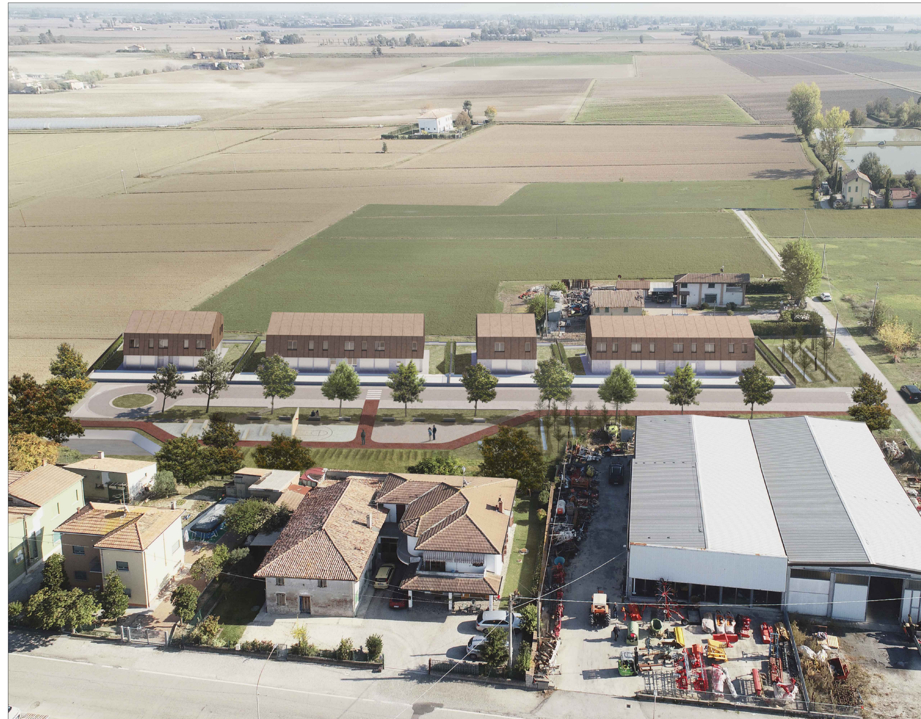
VISTA ESTERNA A VOLO D'UCCELLO - VERDE E EDIFICATO