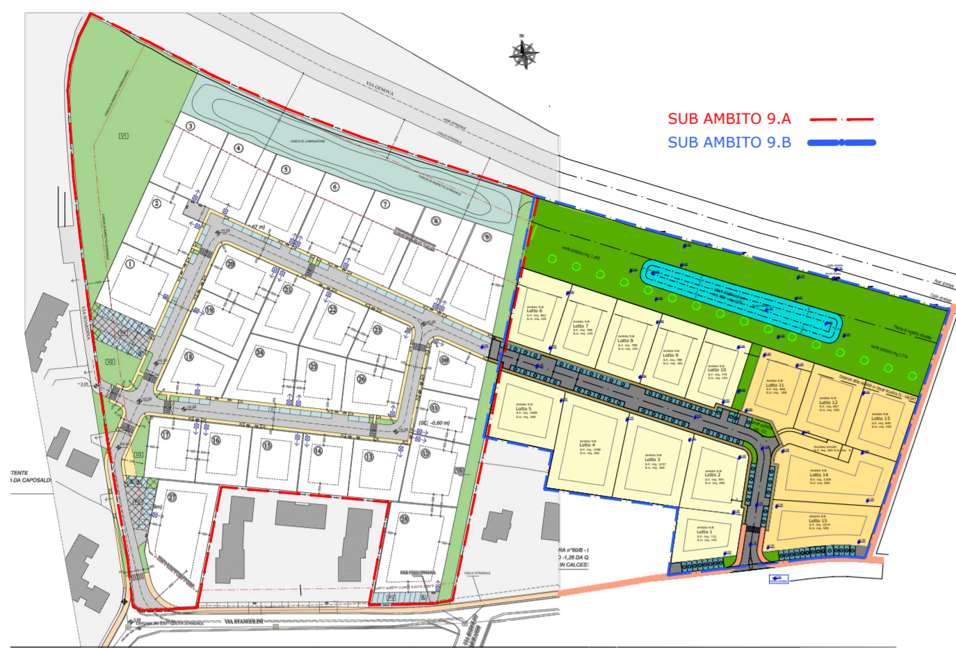
planimetria generale Sub Ambiti 9.A e 9.B - scala 1:2500